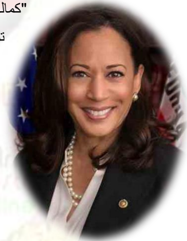
معاون رئیس جمهور کماله هریس

آراء اکثریت ملت امریکا در انتخاب "جو بایدن" به حیث رئیس جمهور و "کماله هریس" به حیث معاون رئیس جمهور تمثیل اراده دموکراتیک ملی است بر مردود ساختن و بستن درب سیاست های حکومت قبلی امریکا بر مبنای نژاد پرستی، تبعیض، اعطای تعریف و مشخصات متمایز به تبعه اصلی امریکا، استهزاء تمسخر و تحقیر ملیت های