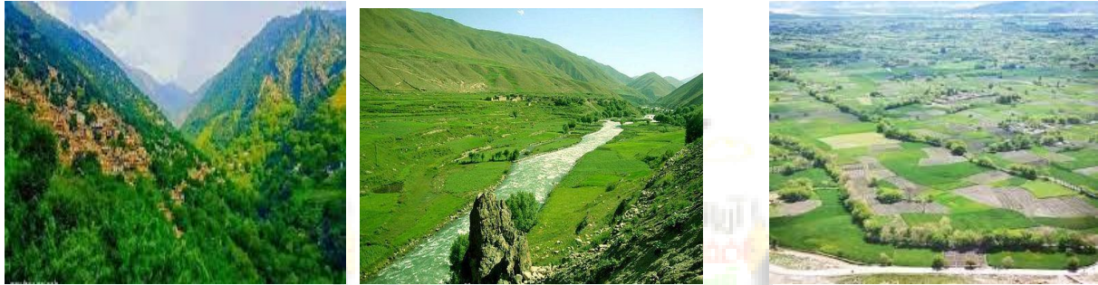
د افغانستان د ښکلي طبیعت درې ښکلي منظرې او زموږ د پټمن او خواریکښ ولس کار او زیار

یوبل سره د اجتماعي، اقتصادي، سياسي او محيطي ډگرونو اتفاقي پايښت باندې تمرکز، د چاپيريال ساتني پالیسيو کي د برياليتوب راز دی. دوام لرونکی پرمختيا او دوام لرونکی اخلاقيات د بشریت هغه له پيرزويني او لوريني ډک فکر دی چې انسان ته د اشرف المخلوقات حیثیت ورکوی او ځمکه (earth/planet) انسان ته د لږ موندل کيدونکو سرچينو او نعمتونو بخښونکی گڼي او دی ته ژمن وی چې باید هغی ته نه جبران کيدونکی زیان ونه رسیری. دا چې دبشر راتلونکو نسلونو ته پاملرنه یو اخلاقي معیار گرځیدلی، په خپله د دې موضوع اهمیت جوتوي.