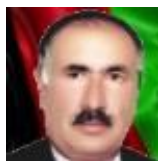
د بشير دوديال د نورو ليكنو لپاره، پر عكس كليك وكړئ