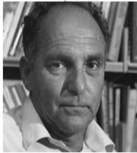
Ernest Gellner Philosoph