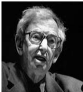
Eric Hobsbawm Historiker