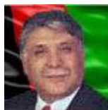
د دغه ليکوال د نورو ليکنو لپاره، دلته کليک وکړئ