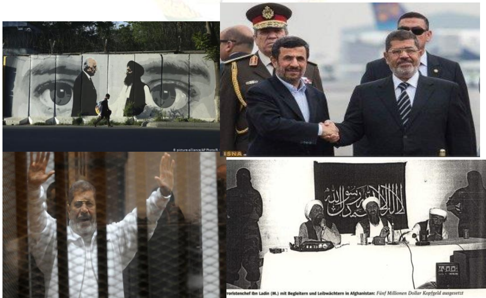
« سرکرده تروریست ها "ابن لادن" (وسط) با محافظان در افغانستان: پنج میلیون دلار جایزه آوردن سر تعیین شده است. »، شپینگل ۱۹۹۸/۲۶م)

تندروان "اسلامی" الجهاد و القاعده، بوکوالحرام بشمول طالبان با وساطت آی. اس. آی استخبارات پاکستان شبکه های نظامی اخوان المسلمین بین المللی تروریستی هستند که تمام فعالیت های خود را مخفیانه سازمان میدهند. تندروان "اسلامی" الجهاد و القاعده، بوکوالحرام بشمول طالبان از "مذهب" و "اسلام" بحیث سرپوش فریبنده استفاده میکنند.